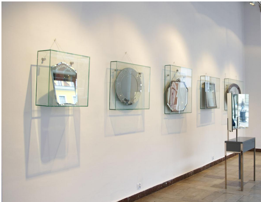
the BWA Design Gallery view/ fragment wystawy BWA Design.